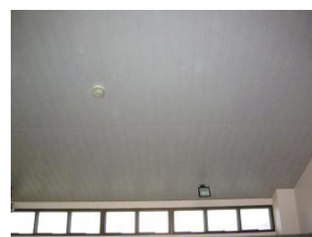
浴室天井面、塗布後1年経過